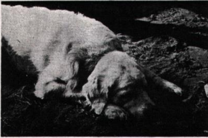
Welverdiende rust voor een 9 maanden jonge Tatra.

sluitend op type, wit, groot, en lang behaard!