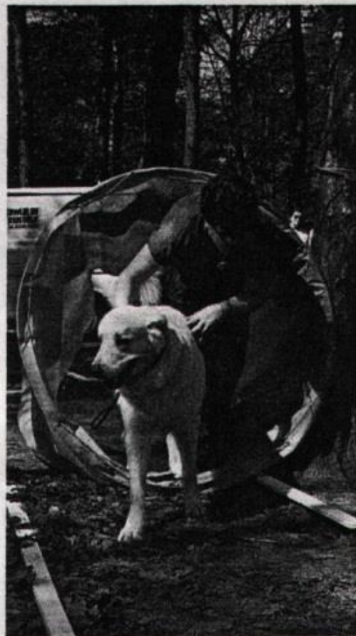
Spel voor baas en hond op de Tatra Evenementendag van de Tatra Club.

Het meest aannemelijke verhaal uit de overleveringen lijkt mij die, waarin wordt verteld dat deze berghond uit Tibet afkomstig is. Bij de verovering van Europa in vroegere eeuwen zouden deze honden met de legers zijn meegekomen en op verschillende plekken zijn achtergebleven. De aanwezigheid van sterk op elkaar gelijkende dieren, en voor het milieu ver-