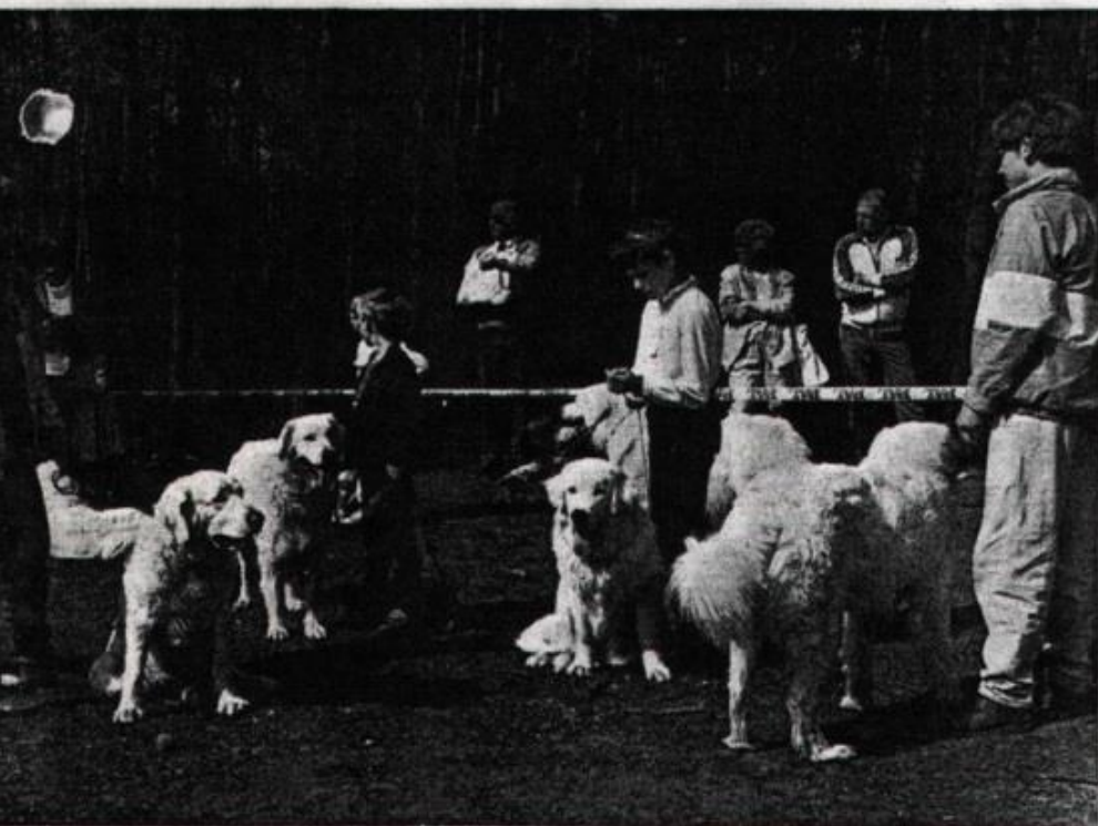
De Tatra een hond voor jong en oud.

De Tatra-hond is een zeer oud ras. De Poolse Kynologie is nog maar recent bezig dit ras naar voren te brengen. Er was geen professionele fokkerij van dit ras. In de dertiger jaren begon men de Tatra-hond voor de liefhebber te propageren. In het toenmalige Polen zette men advertenties als 'in elk Pools gezin een Poolse hond, de Tatra-hond beslist naar uw zin'. In de hondenfokkerij lette men toen uit-